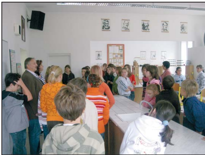
Na návštěvě v Trnávce

Měsíc říjen byl ve znamení návštěv našich partnerských škol. Za zmínku stojí, že naše škola rozvíjí spolupráci se třemi základními školami. Jsou to dvě školy v ČR a jedna škola na Slovensku. Nejdéle naše škola spolupracuje se ZŠ TGM Blansko. Po navázání kontaktů mezi řediteli škol na podzim roku 2007 spolupráce