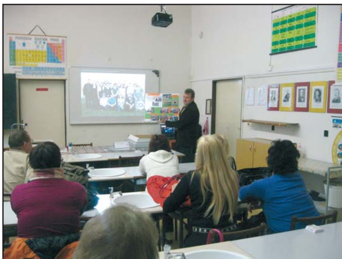
Pedagogové z ZŠ Budkovce na návštěvě v Koryčanech