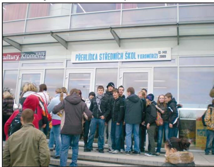
Přehlídka středních škol

pokračovala návštěvou pedagogických pracovníků na jaře roku 2008 na škole v Blansku. V obdobném duchu se nesl i pobyt pracovníků blanenské školy v říjnu letošního roku v naší škole. Pro naše přátele byl sestaven bohatý a časově dost náročný celodenní program, jehož součástí byla prohlídka interiéru naší školy, hospitace v hodinách vedených našimi učiteli, prezentace naší školy a města, vzájemné sportovní utkání ve volejbalu