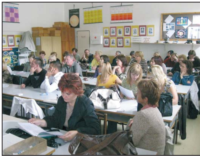
Návštěva z partnerské slovenské školy