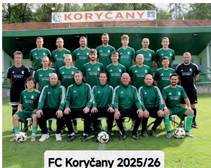
FC Koryčany 2025/26