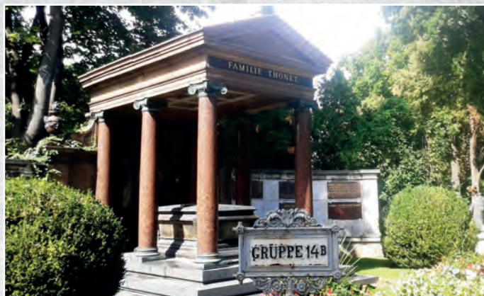
Rodinná hrobka Thonetů ve Vídni na centrálním hřbitově