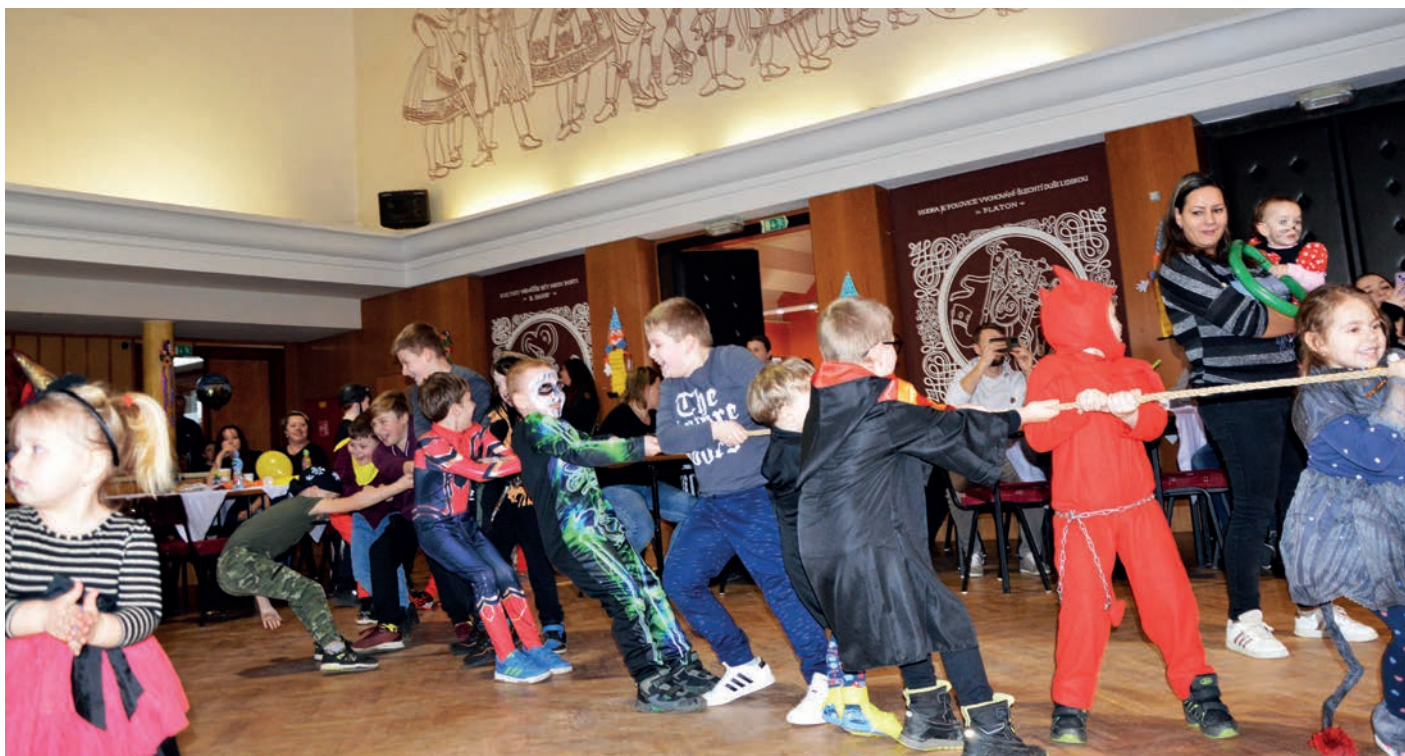
Mateřská škola - karneval v KD Koryčany