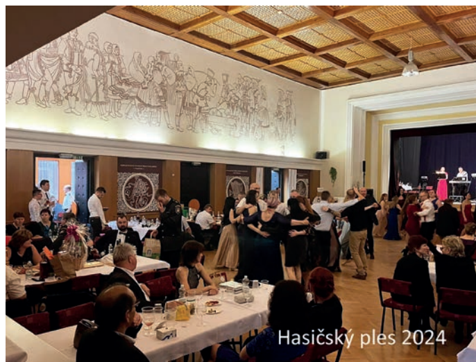
Hasičský ples 2024

Mezi hlavní události letošního roku patří jednoznačně oslava výročí založení sboru. Celá slavnost proběhne 22. 6. 2024. Těšit se můžete na výstavu historické i moderní hasičské techniky, policie a zdravotnické záchranné