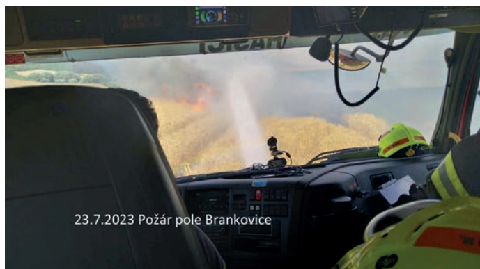
23.7.2023 Požár pole Brankovice

Neděle 23. 7. 2023 zaměstnala naplno nejen naše hasiče z Koryčan. V 11:42 byl vyhlášen první požární poplach. Jednotka vyrazila k požáru strniště u obce