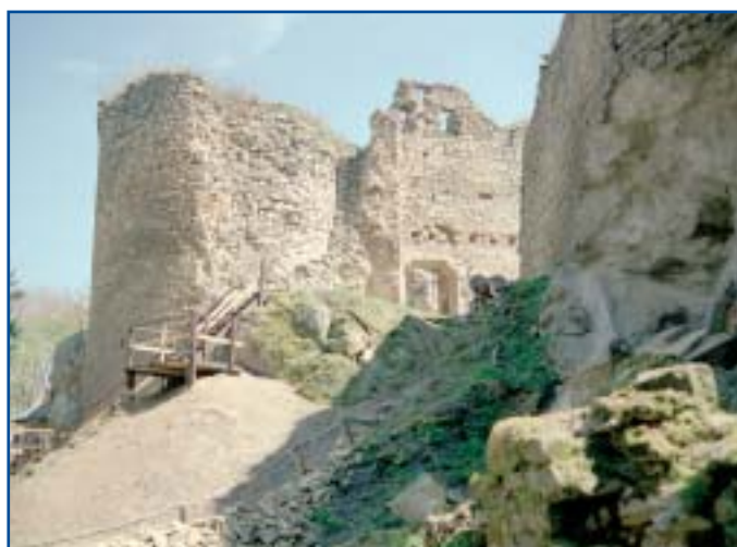
šijová hradba se vstupem do sklepa (před archeologickým průzkumem)