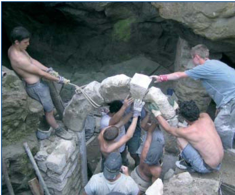
dobrovolníci osazují původní portál vstupu do sklepa