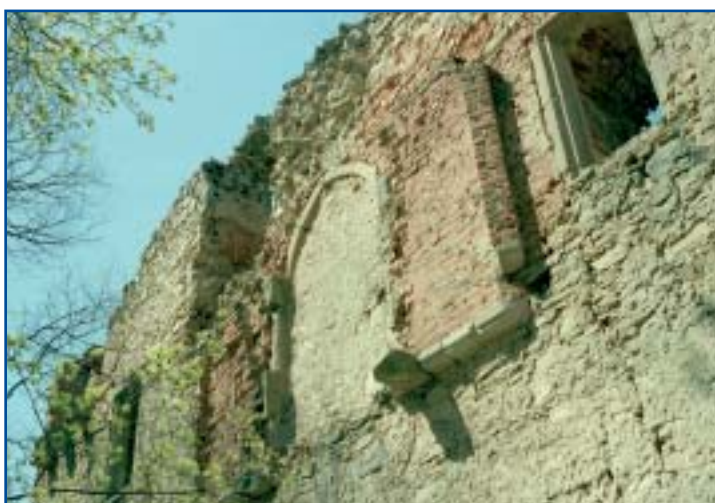
torzo arkýře nad hradním parkánem (před konzervací)