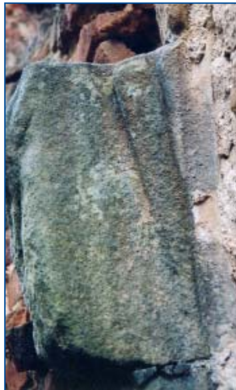
výběh klenebního žebra na arkýř